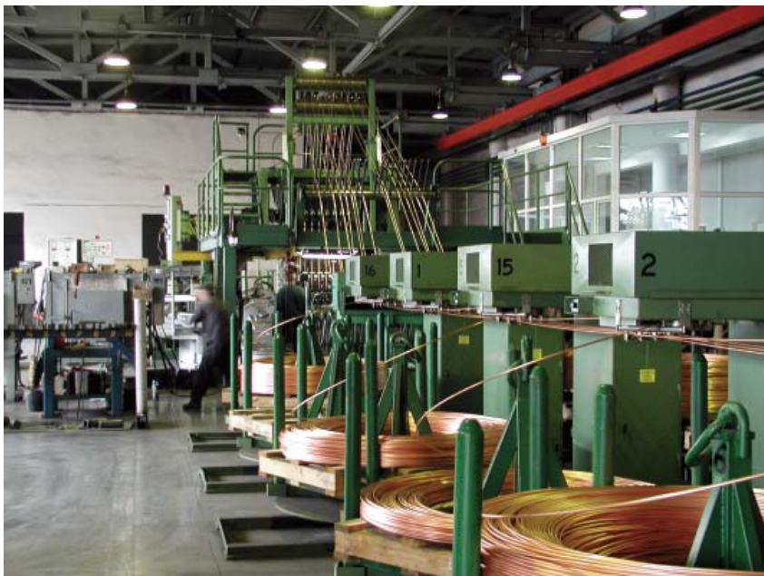
Металлургический цех по производству медной катанки

продукции, которых требует потребитель: начиная с кабелей для бытовых электроприборов, освещения и отопления, телефонной и мобильной связи, телевидения и компьютеров, заканчивая кабелями для строительства жилых комплексов, метрополитенов и атомных электростанций. На сегодняшний день предприятие владеет собственной научно-технической базой, аккредитованной испытательной лабораторией и высокопрофессиональными работниками, что позволяет разрабатывать и производить более 3 000 маркоразмеров кабелей. Но даже не в широком спектре производимой продукции заключается успех «Одескабель» на рынке, а скорее, в гарантированном качестве кабеля. Ведь продукт кабельной индустрии, прежде всего, должен быть безопасным, надежным и долговечным. По статистике, причиной большинства пожаров в жилых помещениях является возгорание кабельной проводки, поэтому качеством прокладываемых кабелей никак нельзя пренебречь. К слову сказать, «Одескабель» довольно много сил и средств уделяет разработкам современных видов огнестойких и пожаробезопасных кабелей, а также с особым вниманием подходит к качеству материалов для их производства. Для своего производства «Одескабель» закупает только сертифицированное сырье, при этом почти 80% всей номенклату-